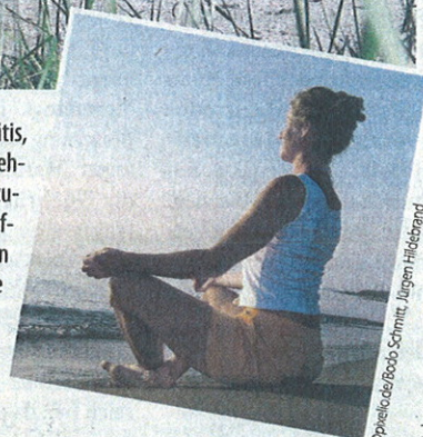
© Heilwörter/Books Schmitt, Jürgen Hildebrand Werbung

Geöffnet: Montag-Freitag: 10-20 Uhr, Samstag: 11-18 Uhr Salzgrotte La Mar, Nordbergstraße 10; Tel. 713 77 17